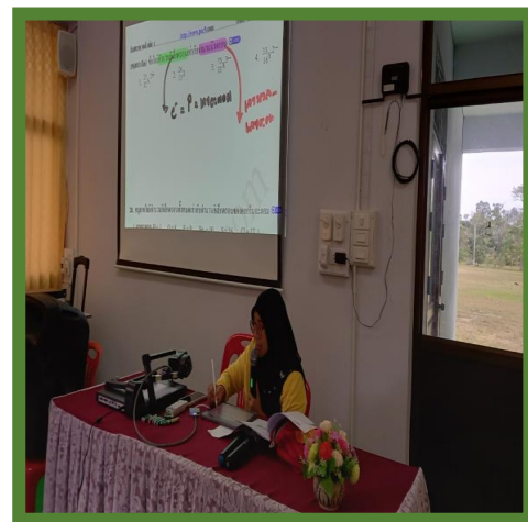
รายวิชาติว O-net