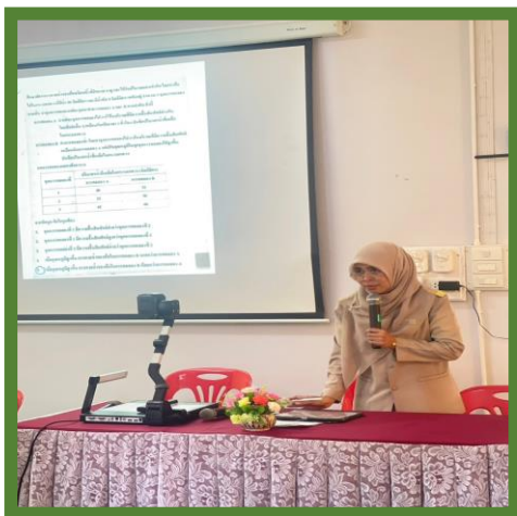
รายวิชาติว O-net

แนวทางการดำเนินงานยกระดับผลสัมฤทธิ์ทางการเรียน เป็นแนวทางในการพัฒนาคุณภาพผู้เรียน เพื่อยกระดับผลสัมฤทธิ์ทางการเรียนที่มีระบบ และเป้าหมายที่ชัดเจน ให้ความสำคัญกับการส่งเสริม และสนับสนุนให้ดำเนินการจัดกิจกรรมส่งเสริมเร่งรัดการจัดการเรียนการสอน เพื่อยกระดับคุณภาพผู้เรียนให้ได้มาตรฐานที่กำหนด และให้มีการนิเทศติดตามผล ให้ความช่วยเหลือกับนักเรียน โดยกำหนดเป็นแนวทางดำเนินการ