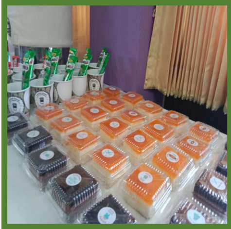
เสริมแรงให้นักเรียน

ครูผู้สอนวิเคราะห์ผลสัมฤทธิ์ทางการเรียนของนักเรียนทุกกลุ่มสาระการเรียนรู้ วิทยามาตรฐาน รายบุคคล รายข้อ เพื่อเป็นข้อมูลพื้นฐานในการวางแผนพัฒนาคุณภาพผู้เรียน วิเคราะห์ปัญหา สาเหตุ กำหนดแนวทางแก้ไข ในสาระ ที่มีผลสัมฤทธิ์ต่ำกว่ามาตรฐาน เพื่อใช้ในการพัฒนาการจัดการเรียนการสอนมาตรฐานการเรียนรู้ที่ควรปรับปรุงแก้ไขให้ดีขึ้น