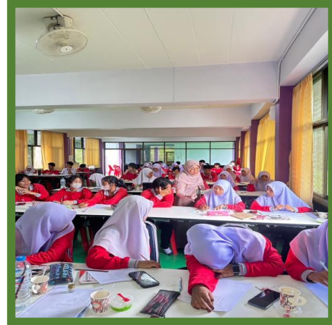
ถาม-ตอบ เนื้อหาที่ดิว

๖.๓ ผลการประเมินความพึงพอใจของผู้เข้าร่วมกิจกรรม